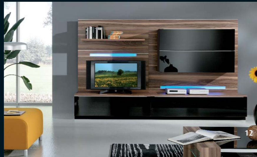
LA 202.1 · schwarz Seidenmatt, schwarz Hochglanz und Nussbaum noce · Breite 270,0 cm.