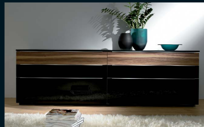
LA 4011 · schwarz Seidenmatt und schwarz Hochglanz · Akzentfronten Nussbaum noce Breite 240,0 cm · durchgehende Abdeckplatte 240,5 cm.