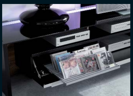
Abb. oben: Couchtisch CT 06 mit Hebefunktion · 140,0 x 75,0 cm · Nussbaum noce und Glas schwarz aus der BHD-Kollektion „dining & more“. Abb. unten: optionaler CD-Auszug für das Lowboard mit Glasoberboden (Code 180 · für ca. 48 CDs).