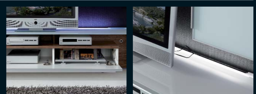
Abb. links: optionales Zubehör für Lowboard mit Glasoberboden: CD-Auszug (Code 180) für ca. 48 CDs - Infrarot-Signal-Übertragungs-Set (Code 994). Abb. rechts: effektvolle LED-Beleuchtung in weiß oder mit RGB-Farbwechsel.

Frischen Sie Ihr Zuhause auf! Klare Formen kombiniert mit optischen Highlights wie der neuen RGB-Beleuchtung machen Ihren Wohnraum zum Wohlfühlraum! Das funktionale Lowboard mit Glasoberboden bietet Stauraum für Ihre Mediageräte samt Zubehör und präsentiert Ihr Heimkino in schönstem Licht. Pfiffige Details wie das integrierte Tablett im Couchtisch zeichnen die neue BHD-Kollektion „dining & more“ aus.