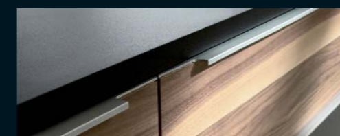
Serienmäßige Griffleiste aus gebürstetem Aluminium