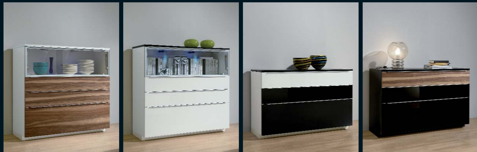
Highboard LA 405 · weiß Seidenmatt und Nussbaum noce · Breite 120,0 cm.