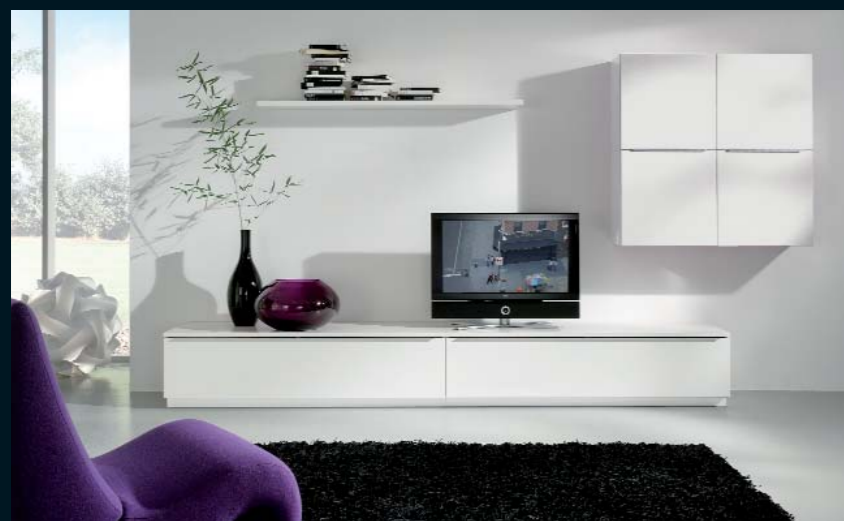
LA 100 · weiß Seidenmatt und weiß Hochglanz · Breite ca. 352,5 cm.