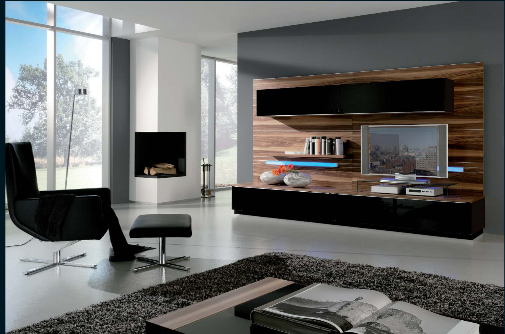
LA 6001 · schwarz Seidenmatt, schwarz Hochglanz und Nussbaum noce · Breite 300,0 cm.