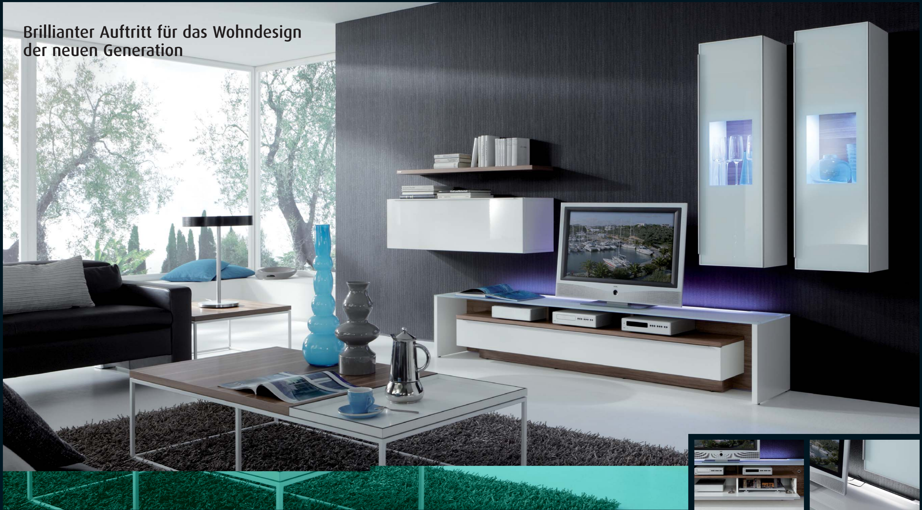
Wohnwand LA 6015 - weiß Seidenmatt, weiß Hochglanz, Glas weiß und Nussbaum noce - B ca. 310,0 cm Couchtisch CT 05 in den Abmessungen 70,0 x 70,0 cm und 140,0 x 70,0 cm - Gestell Lack weiß, Platte Nussbaum Echtholzturnier, Tablett Bicolor weiß mit schwarzem Kern.