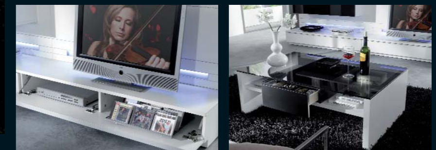
Abb. links: optionales Zubehör für Lowboards: CD-Auszug (Code 180) für ca. 48 CDs · Infrarot-Signal-Übertragungs-Set (Code 994) · effektvolle LED-Beleuchtung für Wandpaneele in weiß, blau oder mit RGB-Farbwechsel. Abb. rechts: Couchtisch CT 04 · 120,0 x 75,0 cm mit Parsolglasplatte und Schubkästen · Lack weiß und Lack schwarz · aus der BHD-Kollektion „dining & more“.

Zurücklehnen und genießen! Die LED-Lichtbänder mit RGB-Farbwechsel für Wandpaneele geben Ihrem Zuhause immer wieder eine neue Ausstrahlung. Basierend auf den drei Grundfarben Rot (wirkt aktivierend), Gelb (wirkt anregend) und Blau (wirkt beruhigend) lassen sich mit der Fernbedienung Farbwechsel und feststehende Lichtfarben programmieren.