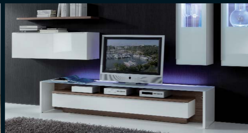
Wohnwand LA 6015 · weiß Seidenmatt, weiß Hochglanz und Nussbaum noce · Galerietüren in Glas weiß · Lowboard mit Glasoberboden in weiß · Rückwand der Bank und Oberboden des Klappenelementes in Nussbaum noce.

Das Lowboard mit Glasoberboden inklusive Kabelmanagement und optionaler LED-Beleuchtung (wahlweise in weiß oder mit RGB-Farbwechsel).