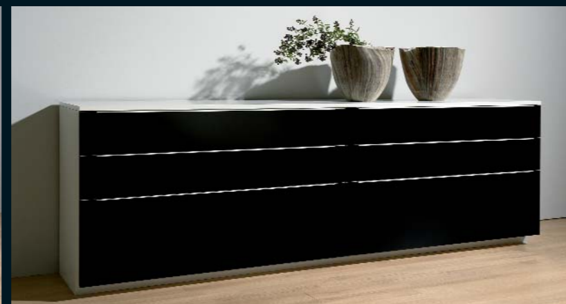
Sideboard LA 401 · weiß Seidenmatt und schwarz Hochglanz · Abdeckplatte weiß Seidenmatt · Breite 240,0 cm.