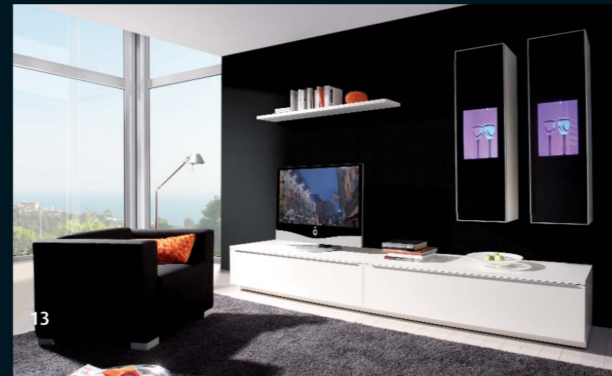
LA 109.1 · weiß Seidenmatt, weiß Hochglanz Galerietür Glas schwarz · Breite 300,0 cm.