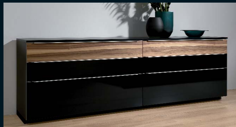
Sideboard LA 401.1 · schwarz Seidenmatt und schwarz Hochglanz · mit Akzentfront Nussbaum noce · Abdeckplatte schwarz Seidenmatt · Breite 240,0 cm.