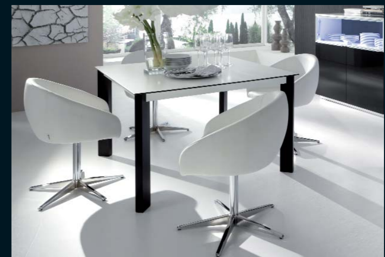
Esstisch ET 02 - 125,0 x 125,0 cm - Gestell Lack schwarz, Platte Bicolor weiß mit schwarzem Kern. Der Esstisch ET 02 aus der BHD-Kollektion „dining & more“ ist wahlweise mit und ohne Auszugsfunktion erhältlich - Stühle: 4 x ST 02 (Code 2623) - Kreuzfuß verchromt, Bezug Leder- optik weiß.

Gesellig in großer Runde – aber auch gemütlich zu zweit: mit dem Esstisch ET 02 aus der BHD-Kollektion „dining & more“ sind Sie auf alles perfekt eingerichtet. Mit der innovativen Beschlagtechnik vergrößern Sie die beiden Tische von 125,0 x 90,0 cm auf 125,0 x 125,0 cm bzw. von 170,0 x 90,0 cm auf 220,0 x 90,0 cm. Zum Verstauen und Präsentieren finden Sie bei life-art eine Vielzahl an schönen Sideboards und Highboards mit Türen, Schubkästen, Klappen und durchgehenden Abdeckplatten bis 240,5 cm.