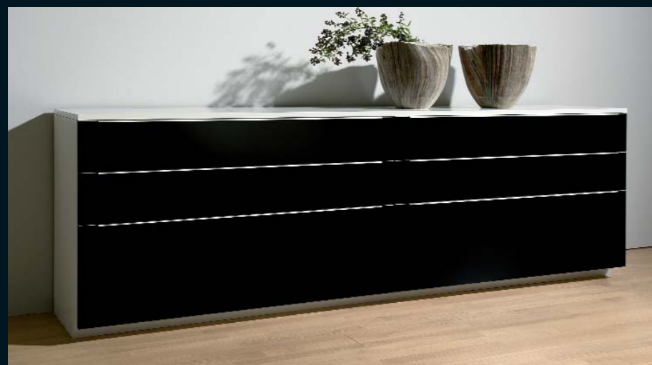
LA 401 - weiß Seidenmatt und schwarz Hochglanz Breite 240,0 cm.