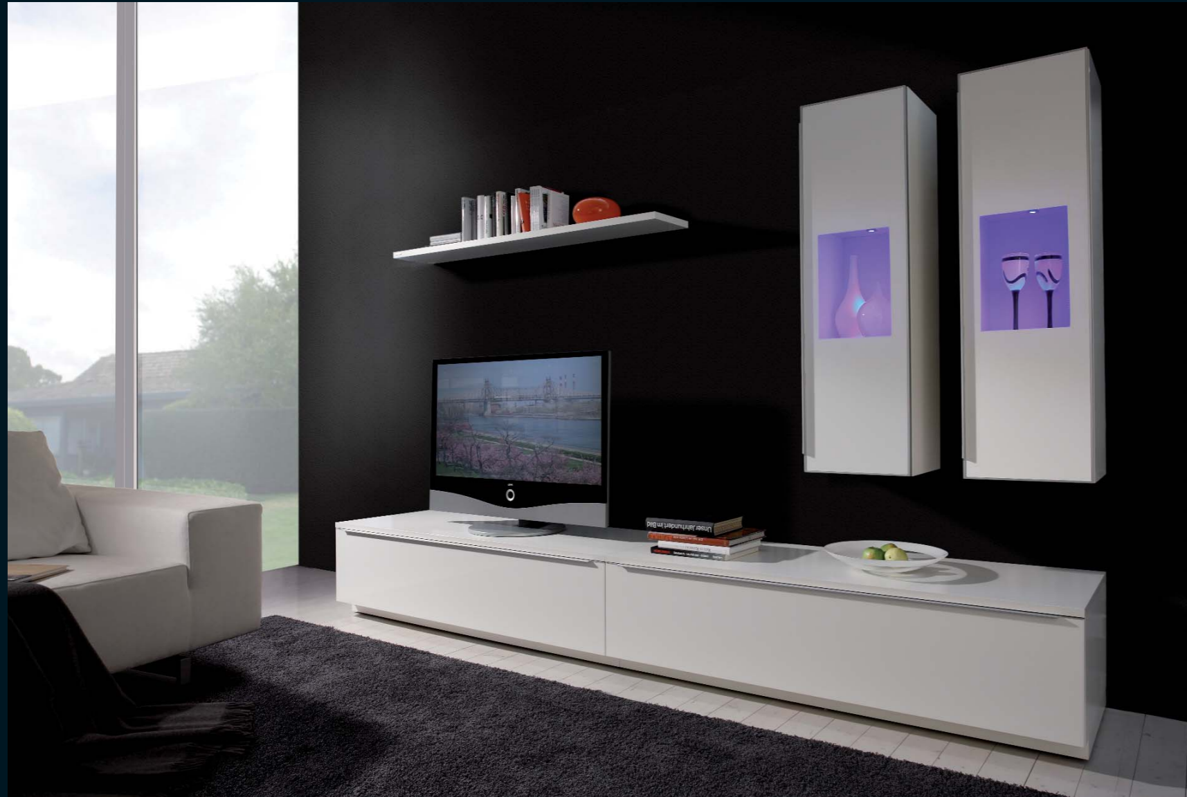
LA 109 · weiß Seidenmatt, weiß Hochglanz · Galerietüren Glas weiß · Breite 300,0 cm.