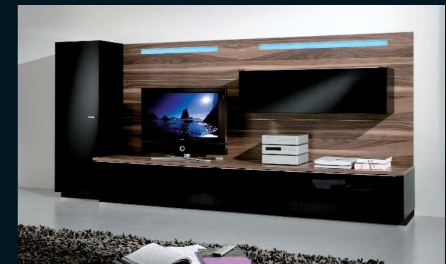
LA 200 · schwarz Seidenmatt, schwarz Hochglanz und Nussbaum noce · Breite 320,0 cm.