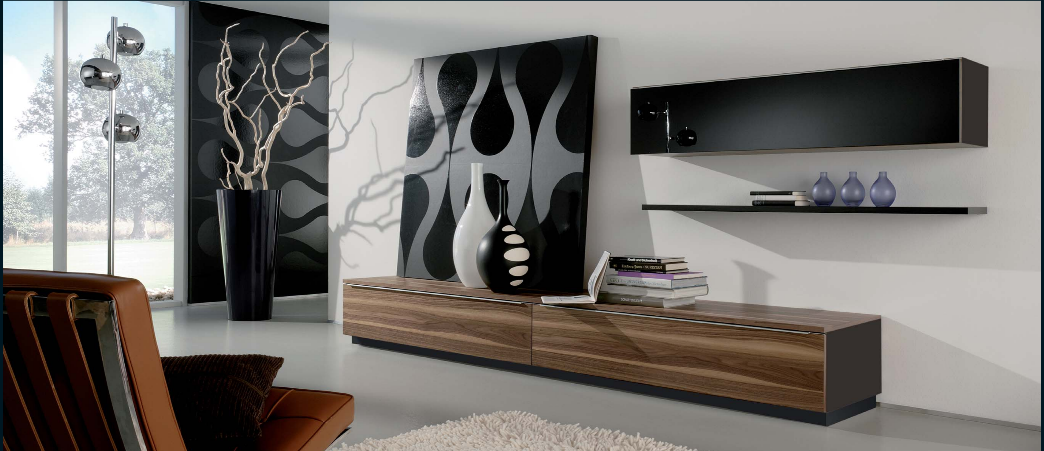
LA 101 · Nussbaum noce · schwarz Seidenmatt und schwarz Hochglanz · Breite ca. 342,0 cm.