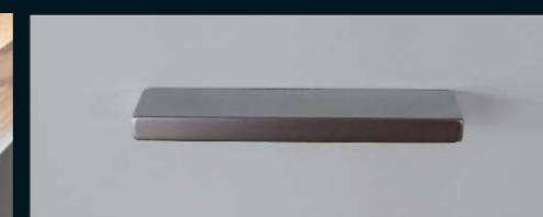
Griff 970, serienmäßig