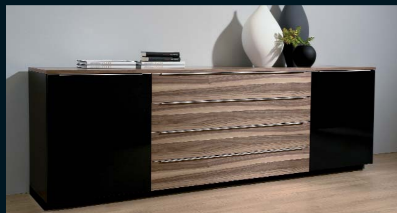
Sideboard LA 400 · schwarz Seidenmatt, schwarz Hochglanz und Nussbaum noce · Abdeckplatte Nussbaum noce · Breite 240,0 cm.