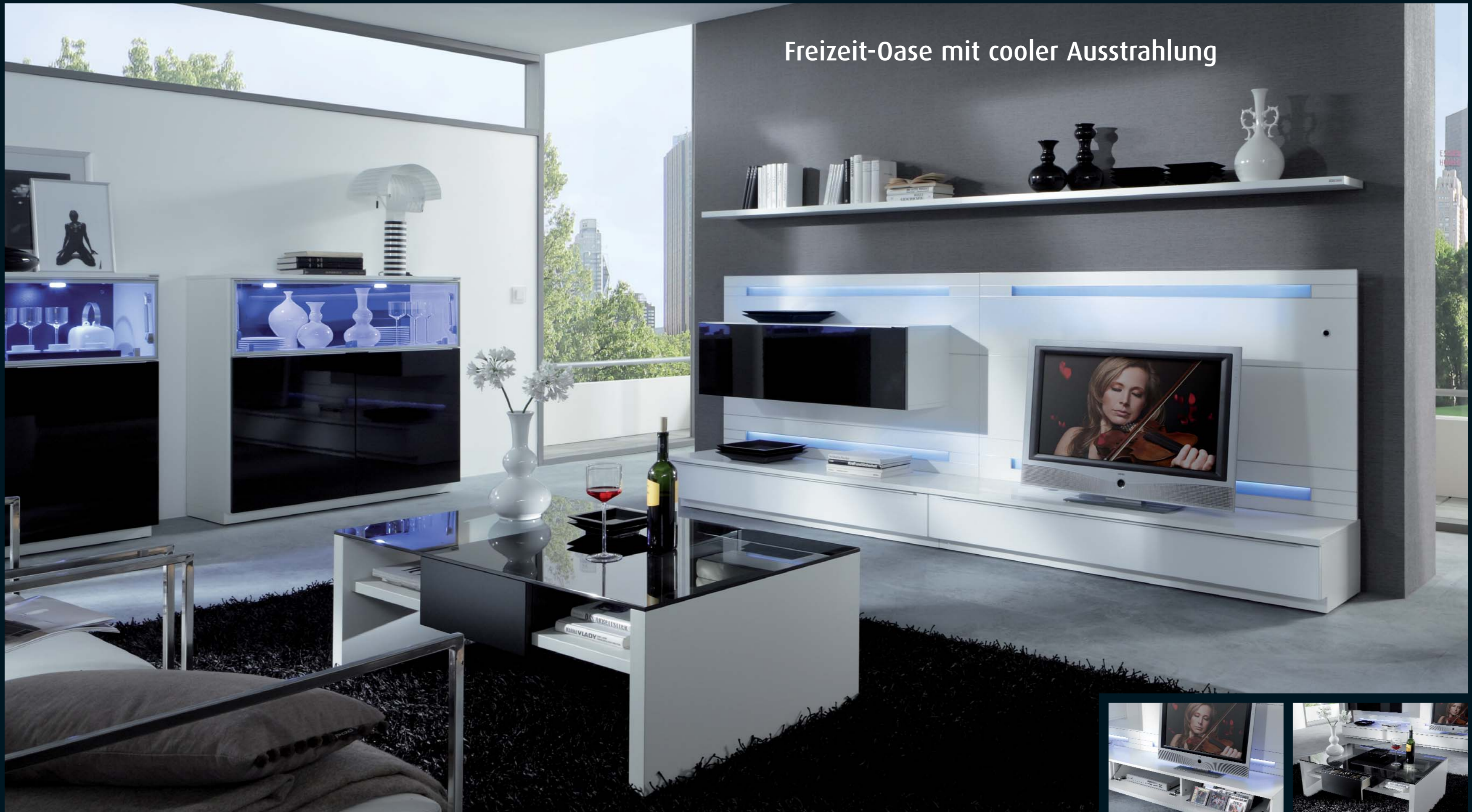
Wohnwand LA 6012 · weiß Seidenmatt, weiß Hochglanz und schwarz Hochglanz · B 300,0 cm 2 x Highboard LA 6013 · weiß Seidenmatt und schwarz Hochglanz · B je 120,5 cm.